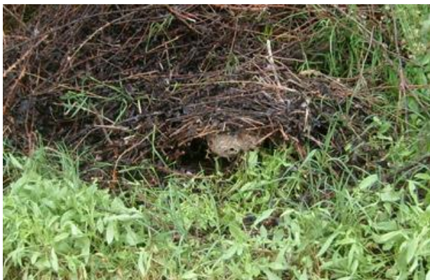
Figure 1 : Nid primaire au printemps http://www.hornissenschutz.ch/vespa-velutina-nth.htm

Le frelon asiatique se propage dans le nord-ouest de la Suisse depuis 2022. Il représente un danger pour les abeilles, les abeilles sauvages et d'autres insectes, ainsi que pour les cultures viticoles et fruitières. Le danger que constitue Vespa velutina pour l'homme n'est pas plus élevé que celui que représentent les frelons ou les guêpes indigènes. Pour ralentir la propagation du frelon asiatique, il est nécessaire de détecter le plus tôt possible les autres nids primaires. Au printemps, les reines construisent de petits nids primaires dans un endroit protégé près du sol ou jusqu'à 3 mètres au-dessus du sol. Au cours de l'année, un nid principal est généralement construit dans un grand arbre ou sur des bâtiments et la colonie se déplace avec la reine. C'est pourquoi, d'avril à début juillet, les autorités de la région du nord-ouest de la Suisse demandent d'observer essentiellement les haies, les abris, les avant-toits et autres endroits protégés du même type. Un pré-nid pourrait s'y trouver. Vous trouverez des exemples ci-dessous (illustrations 1 et 3).