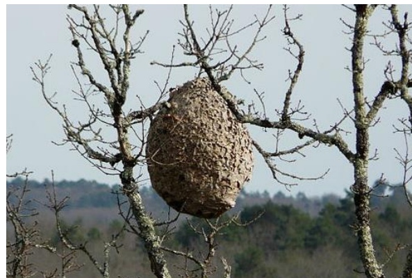
Figure 2 : Nid dans la cime d'un arbre

Nous vous prions de signaler les nids primaires et les nids secondaires suspects ainsi que les insectes (avec photo et coordonnées) au centre de signalement des insectes et des nids suspects :